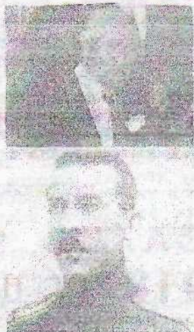
Генерал Е.И. Старицкий и полковник К.И. Щербаков.